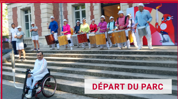
DÉPART DU PARC

Après le cauchemar des élections Européennes et Législatives, fort heureusement, il y a eu la parenthèse enchantée des Jeux Olympiques et Paralympiques.