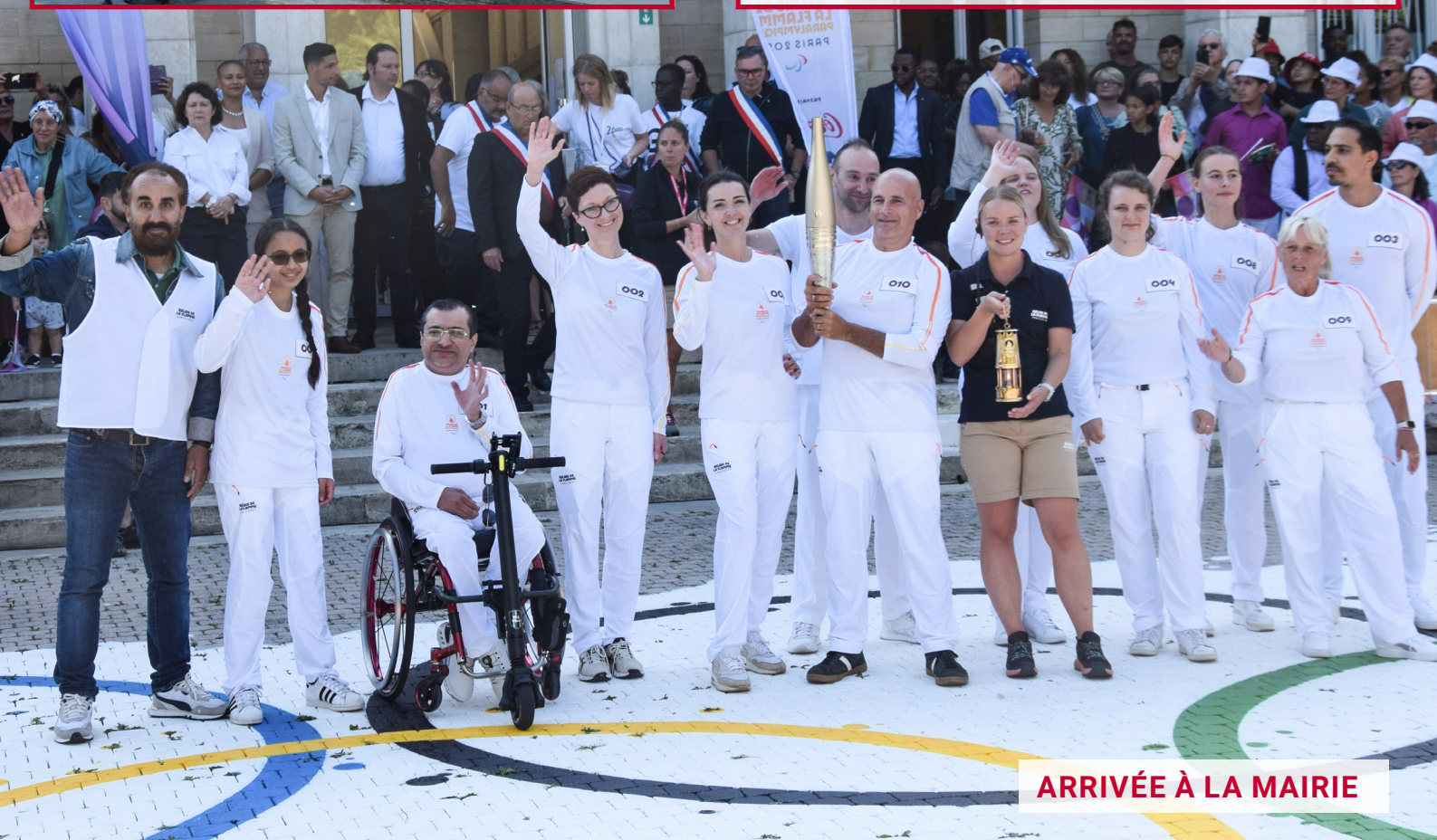
ARRIVÉE À LA MAIRIE